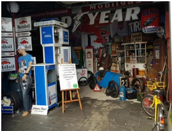
Foto: Ein Hauch von Renngeschichte

Man könnte sagen, es war das Highlight der diesjährigen Mitgliederversammlung, auf das sich die Beteiligten diebstahlsüchtig gefreut hatten: Das Go-Kart-Rennen auf der Indoor-Bahn des Nürburgringes. „Sobald ich im Go-Kart sitze, wandelt sich das Blut in meinen Adern zu Benzin“, so ein aufgeregter Teilnehmer kurz vor dem Start.