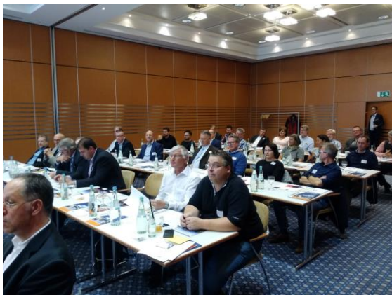
Foto: Obwohl der Blick auf die Rennstrecke sicher attraktiver gewesen wäre, waren die Beteiligten der Mitgliederversammlung interessiert dabei.

Die ESN-Mitgliederversammlung fand anschließend im Dorint Hotel Am Nürburgring Hocheifel statt, das direkt an der Grand-Prix-Strecke gelegen ist. Während draußen auf der Rennstrecke trainiert wurde, eröffnete der ESN-Vorstandsvorsitzende Otto Dorozala die Sitzung und ließ die beiden letzten bewegten Jahre der ESN Revue passieren.