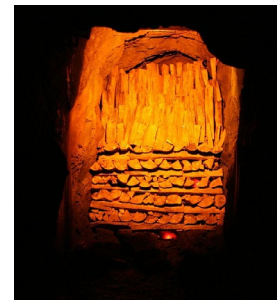
Der Röder Stollen

Gestärkt können wir dann von 15 - 17 Uhr in der atmosphärischen "Schmiede" im Rammelsberg die Mitgliederversammlung abhalten.