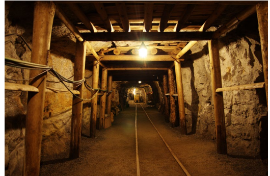
Ein herzliches „Glück Auf“