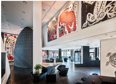
Die kunstvolle Lobby des Hotel Penck

Wir haben dieses Jahr auf ein umfangreiches Rahmenprogramm zur ESN-Mitgliederversammlung verzichtet, da am nächsten Tag (11. Juni 2026) nur 5 Fußminuten entfernt von unserem Veranstaltungsort die Mitgliederversammlung von BDSV und VDM im Congress Center Dresden stattfindet. Verbinden Sie doch gerne beide Veranstaltungen und lernen so auch gleich Dresden noch etwas besser kennen.