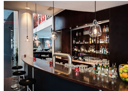
Bar und Restaurant im Hotel Penck laden zum gemütlichen und persönlichen Austausch bei einem saisonalen Dinner Buffet ein.

Die historische Altstadt von Dresden ist in nur wenigen Minuten zu Fuß vom Hotel aus zu erreichen.