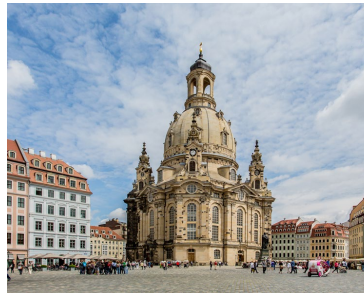
Der Dresdener Neumarkt mit Frauenkirche

Die historische Altstadt von Dresden ist in nur wenigen Minuten zu Fuß vom Hotel aus zu erreichen.